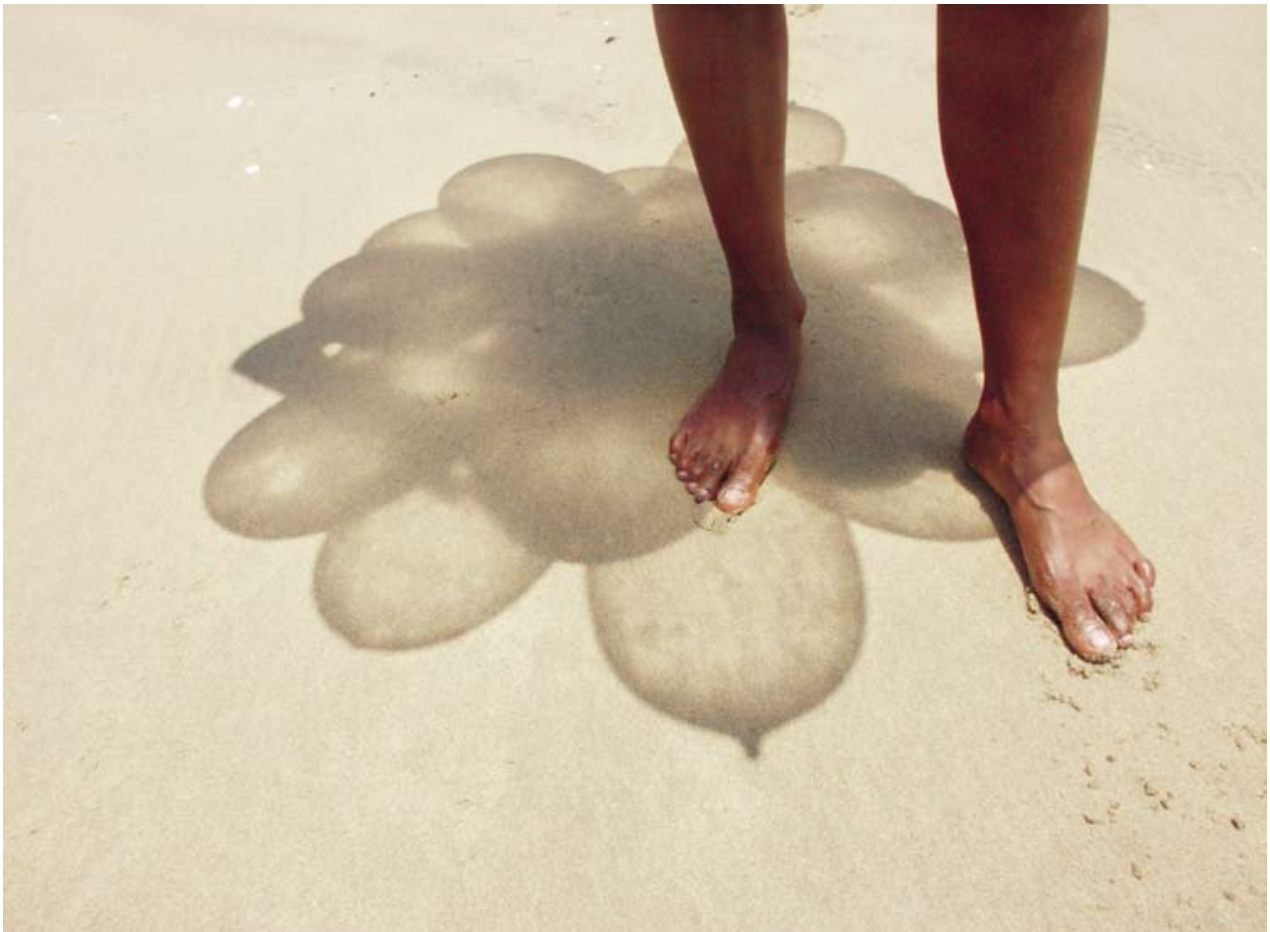
Links: 'Zol' (zelfportret)

Muholi's expositie Only half the picture , waarvan de foto's op deze pagina's deel uitmaken, viert de nu zichtbare seksualiteit van lesbische vrouwen in Zuid-Afrika, maar toont tevens de hoge prijs die nog vaak voor deze coming out betaald wordt.